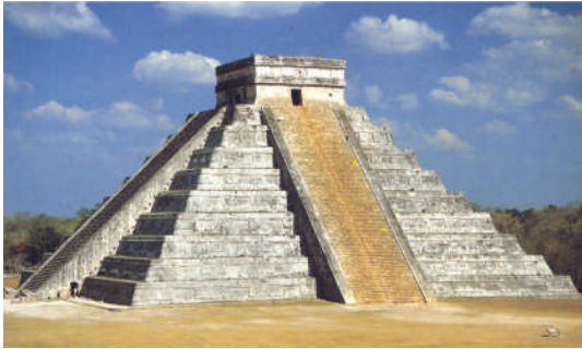
Abbildung 1: die Kukulkan-Pyramide

Fälschlicherweise schreibt man die Anzahl ihrer Stufen (91 pro Seite) in Verbindung mit der Plattform dem heutigen Jahr mit 365 Tagen zu. Die 91 hat jedoch eine ganz andere Bedeutung, wir finden sie gleichfalls in der Anzahl der Stufen zum Hatschepsut-Tempel in Luxor. Hier muss man sowohl Mathematik wie Mystik miteinander verbinden. So, wie im Altertum die Zahl 78 als Summe aller Zahlen von 1 bis 12 in Europa eine Sonderrolle gespielt hat, so spielte die